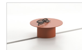
Mensola per accessori