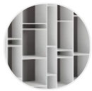
Laccato opaco bianco X042