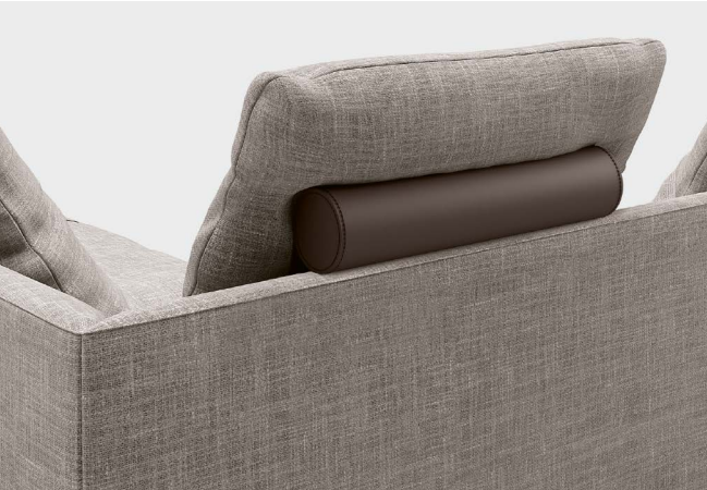
Akkurate Haltung gewünscht? Die Nackenrolle aus Sattelleder unterstützt aufrechtes Sitzen. Sie lässt sich beliebig positionieren