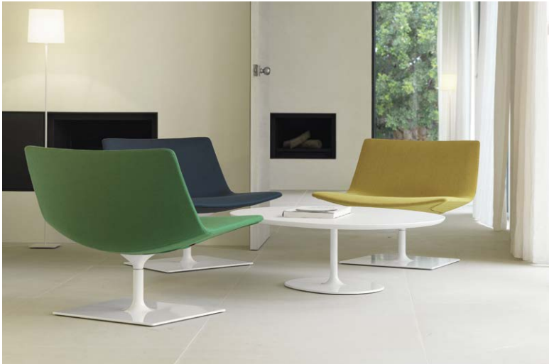
1 Lounge area Art. 2025 Art. 0689 Dizzie