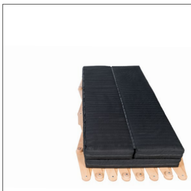
Einzelbett, Scheren-Bett mit Thut-Matratze 3-teilig.