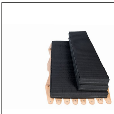
Bettsofa, Scheren-Bett mit Thut-Matratze 3-teilig.

Das Bett wird aus Schweizer Buche gefertigt und ist montiert oder zur Selbstmontage erhältlich. Folgende Ausführungen sind möglich: Buche natur ohne Lackierung, Buche natur lackiert, Buche schwarz, weiss oder farbig nach RAL/NCS lackiert. Das Bett lässt sich ein- oder beidseitig mit dem kleinen Tisch 991 und mit der Schwenkleuchte «Lifto» (Design: Benjamin Thut) ausstatten. Die klappbare Thut-Matratze, 2- oder 3-teilig ist ebenfalls als Zubehör erhältlich.