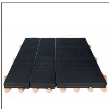
Doppelbett, Scheren-Bett mit Thut-Matratze 3-teilig.

Holzdeklaration: Schweizer Buche oder Buche aus der EU (mehr als 5 Länder – gemäss Verordnung Art. 3 Abs. 4).