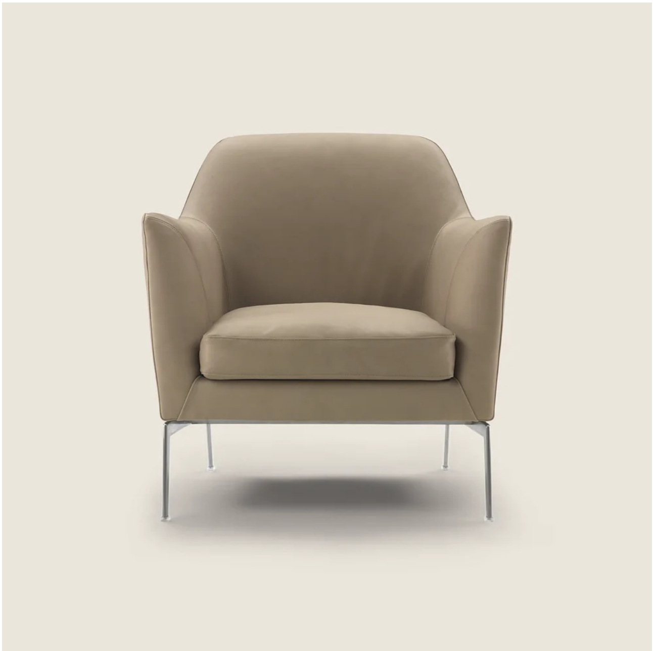
LUCE ANTONIO CITTERIO 2015 POLTRONE