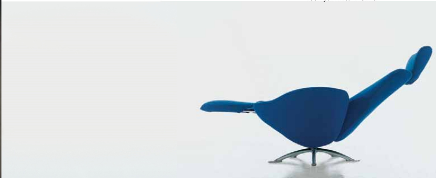
Toshiyuki Kita DODO