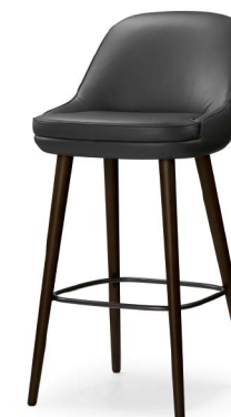
Back-up: Der 375 Barstool mit Rückenlehne wurde für entspanntes Sitzen an der Theke entwickelt

»Wir wollten einen klassischen Barhocker entwickeln, der hohen Sitzkomfort bietet, doch im Raum leicht, ja transparent erscheint.«