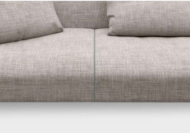
Die offene Ziernaht im Sitzbezug zeugt von hoher Handwerkskunst