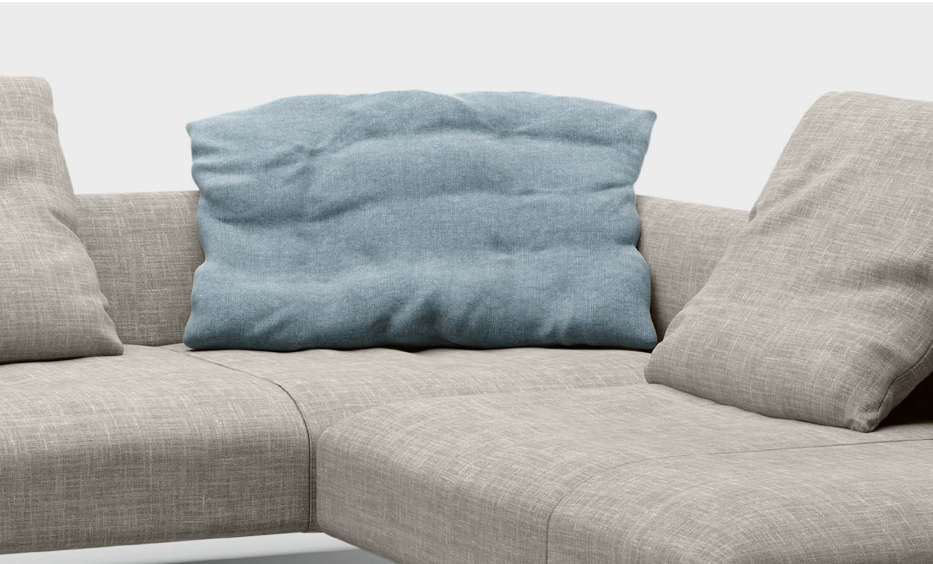
Mit dem neuartigen Dream Cushion , einem Daunenkissen, lässt sich die Sofaecke weich und stabil zugleich ausformen