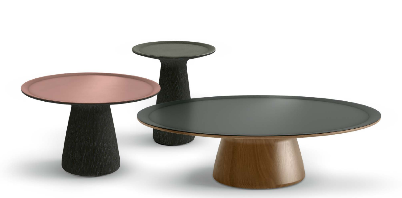
Massiv und sinnlich: Die Beistelltische mit Durchmessern von vierzig, sechzig und hundert Zentimetern lassen sich zu kunstvollen Ensembles kombinieren

Foster 620 Table schafft die Kultivierung des Ursprünglichen, sein Design bewahrt und zähmt die natürliche Ressource Holz. Organische Formen, die seidig weichen und ledernen Oberflächen der Tischplatten lassen einen Beistelltisch entstehen, der berührt und berührt werden möchte.