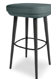
Open-minded: Barhocker für jede Gelegenheit, in zwei Sitzhöhen