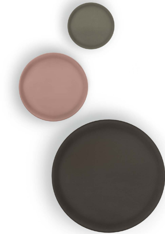
Vielfältige Akzente im Raum: Die Tischplatten sind erhältlich in mattem Schwarz oder Bronze, kupferfarben lackiert oder mit Leder bezogen

Norman Foster gehört zu den erfolgreichsten Architekten unserer Zeit. Weltweit setzen seine Bauten Maßstäbe für intelligente, außergewöhnliche Architektur. Der Brite erhielt den Pritzker-Preis und die Gold Medal for Architecture des American Institute of Architects, und er wurde von der Queen mit dem Titel Lord Foster of Thames Bank geehrt. Die Zusammenarbeit von Norman Foster und Walter Knoll begann mit der Ausstattung des Berliner Reichstagsgebäudes. Seither entstanden mit Foster mehrere Programme für die Synthese von Architektur und Einrichtung, darunter die Sofas und Sessel Foster 500 .