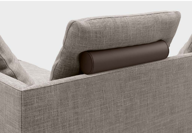
Akkurate Haltung gewünscht? Die Nackenrolle aus Sattelleder unterstützt aufrechtes Sitzen. Sie lässt sich beliebig positionieren