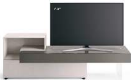
Lampo Open 4 L / W 2250 x H 735 x P / D 354 / 546. TV max 65"