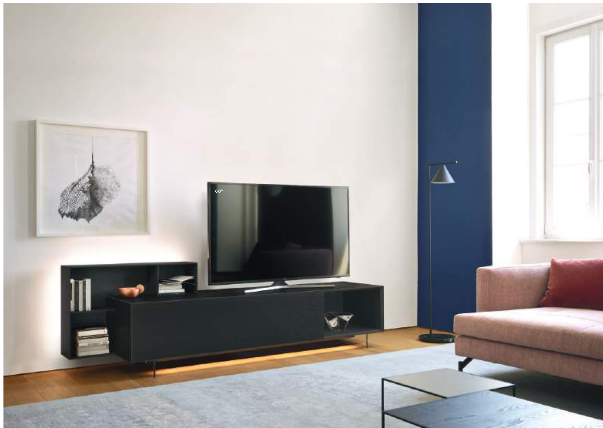
Domino Più 8L sx L / W 2400 x H 495 / 720 x P / D 546 / 245 TV max 65"

Questa tipologia di basi Domino Più è composta da una base lineare e da un elemento a giorno di profondità P 250 mm che oltre a creare un effetto dinamico, funge da libreria di servizio. La composizione può inoltre essere retroilluminata per creare una piacevole atmosfera. Nell'immagine a sinistra vediamo una composizione in Rovere Carbone con interno del contenitore in finitura Brown, piedi in metacrilato H 120 mm.