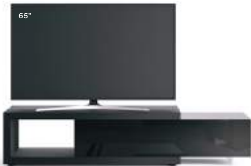
Lampo Sp60 2 L / W 2100 x H 460 x P / D 546 Rovere Carbone • Nero Lucido