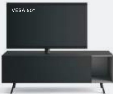
Domino Mono L / W 1500 x H 525 x P / D 546 Rovere Carbone-Piombo • piedi / feet Brown