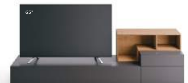
Lampo Open 11 L / W 2400 x H 655 x P / D 354 / 450. TV max 65" Nodato Caramello • Brown