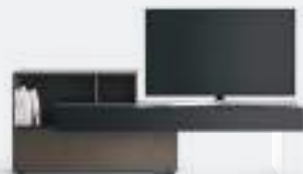
Lampo Open p 82