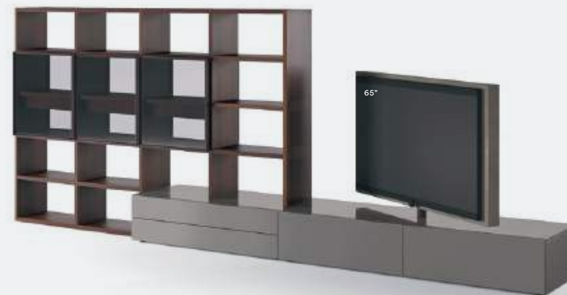
Roto 11 L / W 4230 x H 1630 x P / D 330 / 570

Questa composizione con libreria bifacciale suddivide e organizza efficacemente lo spazio giorno. Il pannello porta TV Roto è dotato di un perno che permette di orientarlo sui due lati: in questo caso, ha una larghezza di ben 1465 mm. Le finiture sono Rovere Termotrattato e laccato metallo Piombo.