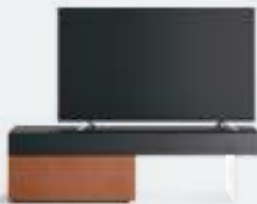
Lampo p 66