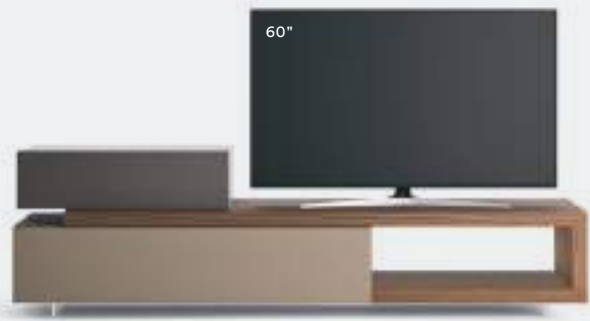
Lampo Sp60 21 L / W 2400 x H 700 x P / D 450 / 546. TV max 65" Noce • Ombra • Antracite