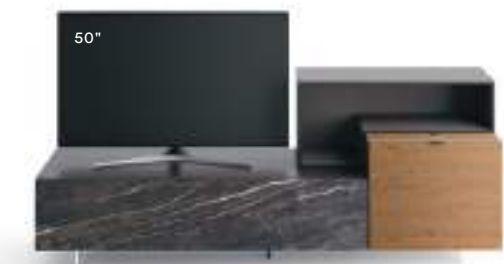
Lampo Open 8 L / W 1950 x H 800 x P / D 354 / 450 Nodato Caramello • Brown • Ceramica Noir Desir • piedi metacrilato / methacrylate feet H 120

The Open TV Unit elements have a slimmer thickness than the elements with doors, and the open compartments can face in different directions, enriching the composition with unique geometries. In the picture, a composition in Loto Natura and Rovere nodato naturale, and an open wall unit in matt Pervinca finish, all on H 120 methacrylate feet.