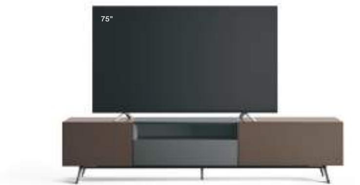
Domino Più 5P sx L / W 2400 x H 525 x P / D 546 Creta • Ferro • piedi / feet Piombo

La retroilluminazione a led è una tecnologia ad alto contenuto di efficienza energetica e sostenibilità ambientale. Nell'immagine a sinistra, la base è in Antracite opaco, i contenitori pensili sono laccati metallo Rame e Bronzo, i pensili con vano a giorno sono in Rovere Carbone con interno laccato metallo Piombo o Bronzo come i piedi.