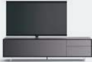
Incontro p 76