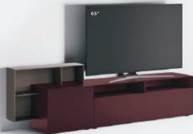
Base Domino Più 11L sx L / W 2400 x H 705 x P / D 245 / 546 Rovere Argilla • Vinaccia