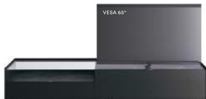
Cabaret 10B dx L / W 2720 x H 555 x P / D 570 – Teca H 160 Rovere Carbone • Top Nero Greco • piedi metacrilato / methacrylate feet H 120

La TV può essere collocata in appoggio sulla base, oppure alcune combinazioni prevedono la possibilità di inserire il supporto TV orientabile Vesa. Per ogni composizione viene riportata la dimensione di schermo consigliata e la dimensione massima utilizzabile.