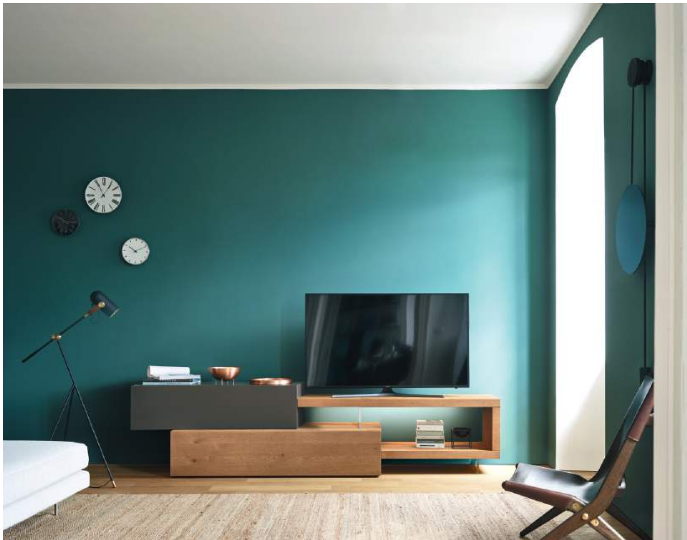
Lampo Sp60 32 L / W 2550 x H 655 x P / D 450 / 546 TV max 60"

Toni naturali, forti spessori e dinamici equilibri, in questa composizione per lo spazio TV tutta giocata sui toni del Rovere nodato Caramello e Brown.