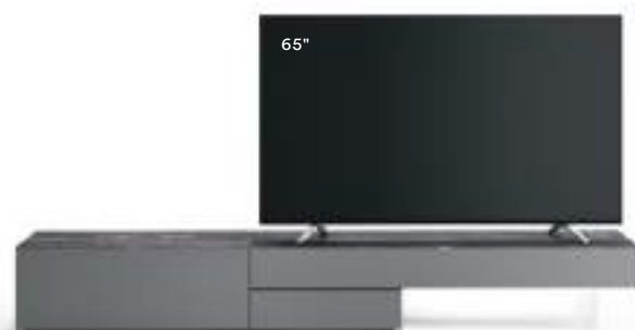
Lampo Basic 17 sx L / W 2400 x H 335 x P / D 546 Ferro • Top Pietra di Savoia