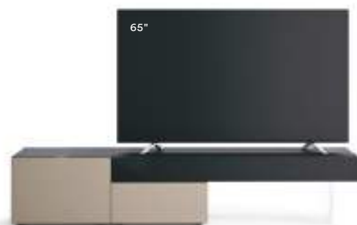
Lampo Basic 21 sx L / W 2100 x H 415 x P / D 546 Rovere Carbone • Ombra