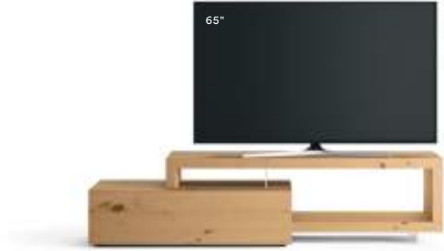
Lampo Sp60 26 L / W 2100 x H 515 x P / D 450 / 546 Nodato Naturale

This modular project with its wide range of finishes offers absolute freedom to create all kinds of different combinations to suit the space available and personal tastes. Recommended and maximum dimensions for the TV set are specified for each element.