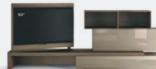
Vision 05 L / W 2700 x H 1165 x P / D 354 / 546 Rovere Argilla • Juta lucido