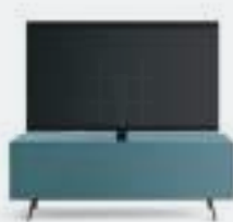
Domino Mono p 4