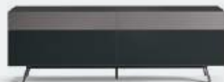
Domino Mono 6M L / W 1792 x H 600 x P / D 546. TV max 75" Rovere Carbone-Brown • Piombo • piedi / feet Piombo