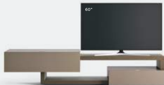
Lampo Sp60 40 L / W 2550 x H 560 x P / D 450 / 546 Rovere Argilla • Ombra