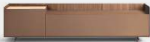
Cabaret 8G sx L / W 2120 x H 515 x P / D 570. TV max 65" – Step H 80 Noce • Bronzo • piedi / feet Bronzo

On the next page, structure and top in Creta lacquer with Noce veneer front panels. Between the volumes is a H 80 mm step forming a tray on which to place the TV.