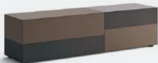
Domino Più 4L L / W 2100 x H 555 x P / D 546 Creta • Brown