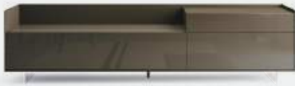
Cabaret 15D dx L / W 2420 x H 635 x P / D 570. TV max 65" – Step H 160 Terranova • Terranova lucido • piedi metacrilato / methacrylate feet H 120