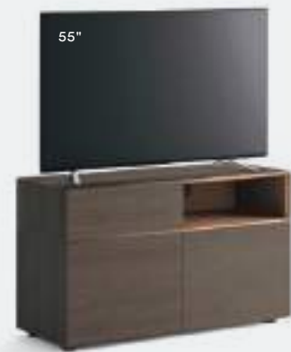
Domino IN.2 1l dx L / W 1200 x H 705 x P / D 452 Rovere Grigio-Bronzo

Domino elements can be stacked to create configurations of a certain height, sitting the TV screen directly on the base or, for upper elements with drop-down doors, using the Vesa swivel stand. In the image on the right, combination of Rovere Argilla with Bronzo.