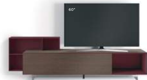
Domino Più 8L sx L / W 2400 x H 495 / 720 x P / D 546 / 245. TV max 65" Rovere Argilla-Vinaccia