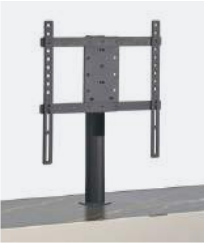
STAFFA VESA / VESA STAND

The drop-down door with aluminium frame and micro-perforated metal panel is available on request, to allow the passage of sound waves and remote control signal for the systems inside.