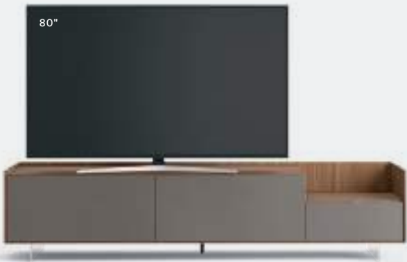
Cabaret 9D sx L / W 2420 x H 555 x P / D 570 – Step H 160 Noce • Piombo • piedi metacrilato / methacrylate feet H 120

An overview of Cabaret bases in various finishes, configurations and sizes, with a play of volumes in height achieved with a lowered 160 mm top, determining different display spaces: simply to hold the TV or to create a tray on which to place assorted objects.