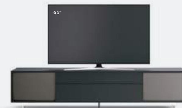
Incontro con riquadro 603 L / W 2430 x H 550 x P / D 561 Rovere Carbone • Piombo • piedi metacrilato / methacrylate feet H 120

Composizioni simmetriche o asimmetriche creano effetti diversi, attraverso il libero abbinamento di volumi, superfici e finiture, arricchite da un segno caratteristico: il riquadro che circonda i frontali come una cornice. A seconda della configurazione della base, la TV può essere semplicemente appoggiata oppure collocata sul supporto orientabile Vesa.