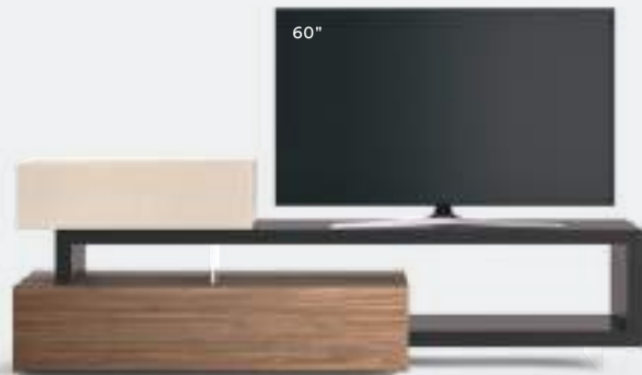
Lampo Sp60 35 L / W 2400 x H 755 x P / D 450 / 546. TV max 65" Noce • Canapa • Terranova Lucido