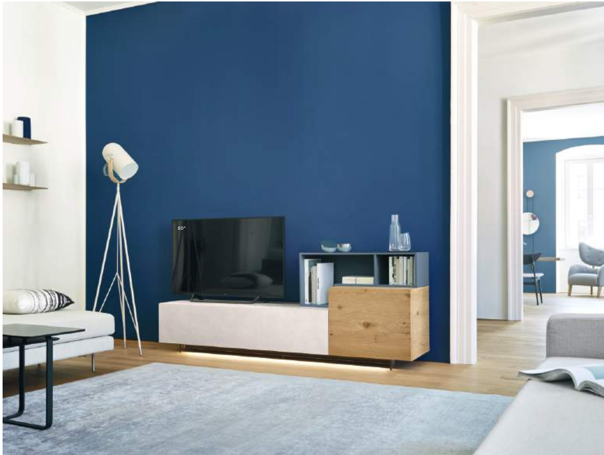
Lampo Open 9 L / W 2100 x H 800 x P / D 354 / 450

Gli elementi TV Units Open presentano spessori più sottili rispetto agli elementi con ante e possono disporre i vani a giorno in diverse direzioni, arricchendo la composizione con inedite geometrie d'uso. Nell'immagine, composizione in Loto Natura, Rovere nodato naturale e elemento a giorno Pervinca opaco, tutto su piedi in metacrilato H 120.