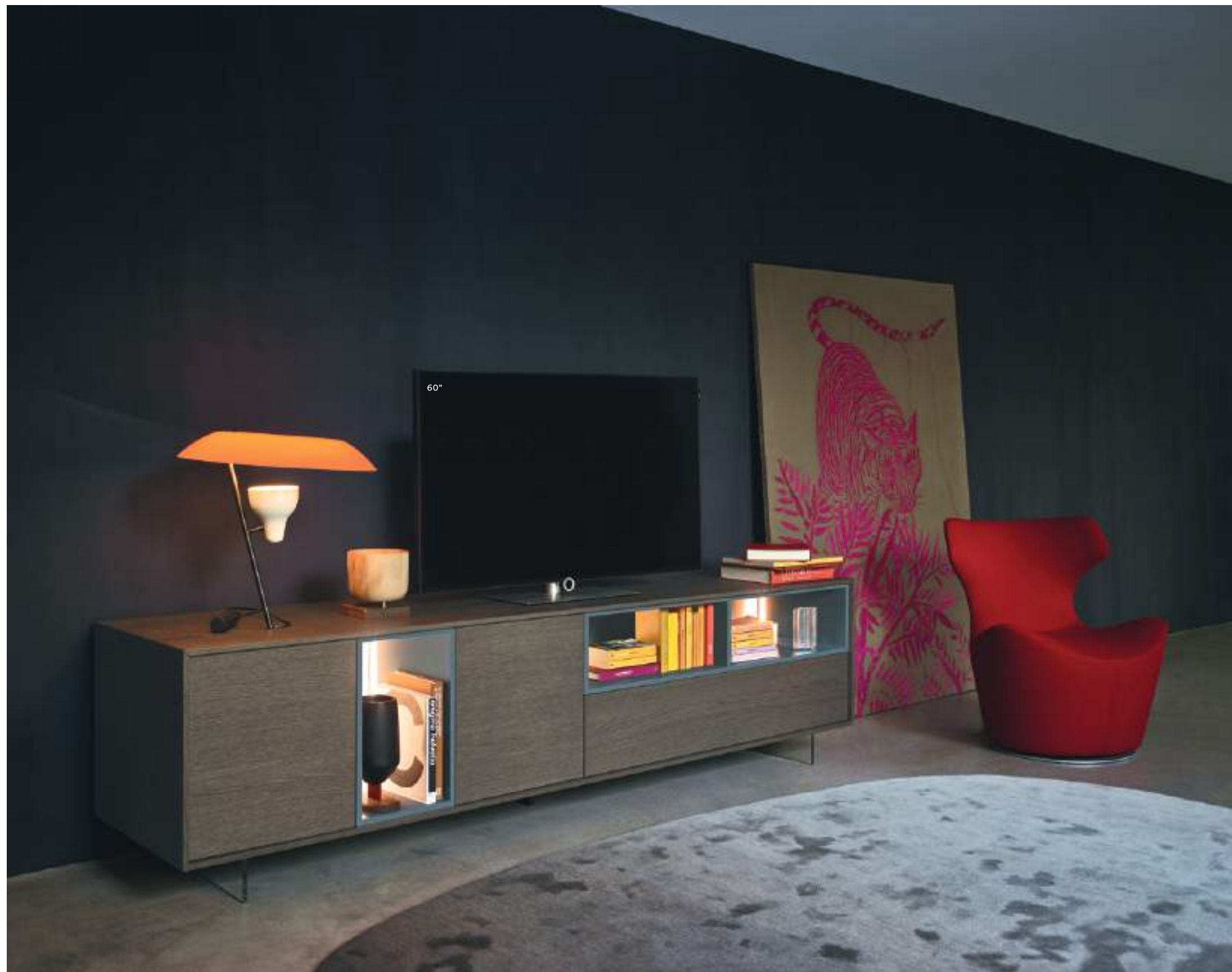
Lampo Open con riquadro 41 L / W 2430 x H 630 x P / D 465

Questa composizione Lampo Open in Rovere Grigio e Pervinca opaco è un gioco di luci, vuoti e pieni racchiusi entro un perimetro e sospesi da terra, con un effetto al tempo stesso rassicurante e dinamico. Con piedi in metacrilato H 120