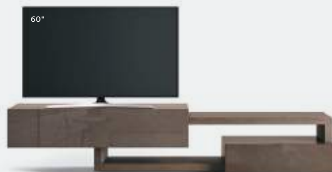
Lampo Sp60 41 L / W 2700 x H 560 x P / D 450 / 546. TV max 65" Rovere Argilla • Creta lucido

Nella stessa composizione, il gioco formale fra i vari elementi si può vestire con diversi colori e finiture, interpretando molteplici stili e personalità.