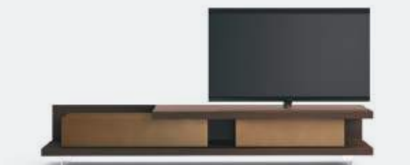
Base Sp60 CDE2708C dx tipo B L / W 2700 x H 480 x P / D 546. Vesa per TV max 65" Rovere Termotrattato • Bronzo