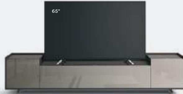
Cabaret 26G L / W 2420 x H 515 x P / D 570 – Step H 80 Brown • Ardesia lucido • piedi / feet Piombo