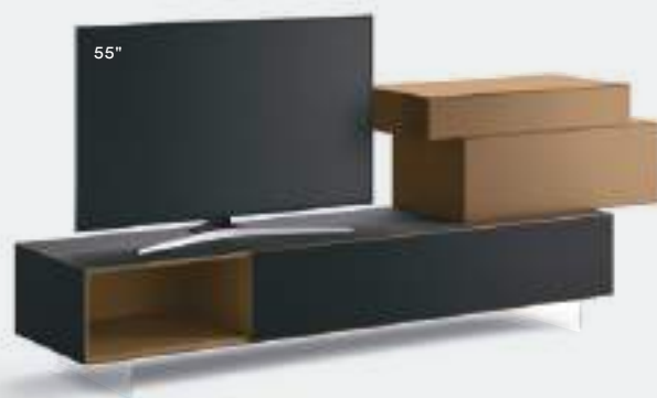
Domino IN.3 22N L / W 2325 x H 870 x P / D 452 / 546 Rovere Carbone • Zenzero