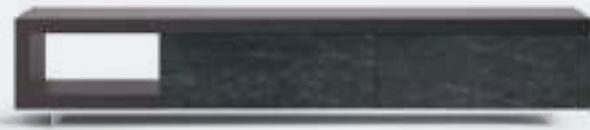
Lampo Sp60 11 L / W 2400 x H 460 x P / D 546 Brown • Ceramica Nero Greco