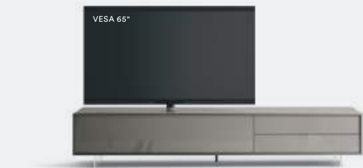
Lampo Basic 5 sx con riquadro L / W 2430 x H 470 x P / D 561 Ardesia • Ardesia lucido • piedi metacrilato / methacrylate feet H 120