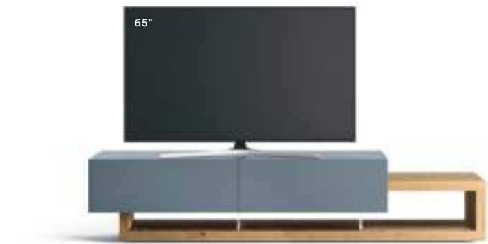
Lampo Sp60 29 L / W 2400 x H 515 x P / D 450 / 546. TV max 70" Nodato Naturale • Pervinca