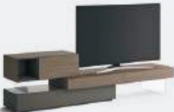
Domino IN.3 p 30