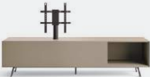
Domino Mono L / W 2100 x H 525 x P / D 546 Ombra • piedi / feet Piombo

The Vesa swivel TV stand is installed where available on Domino bases with drop-down door, enabling fixing and orientation of the TV, as well as internal passage of cables. The stand comes with standard Vesa drilling that accommodates TVs with 32" to 65" screens. The images show different possibilities giving you an equipped TV base, even with only one element.