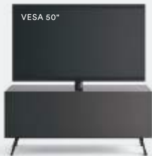
Domino Mono L / W 1200 x H 525 x P / D 546 Brown