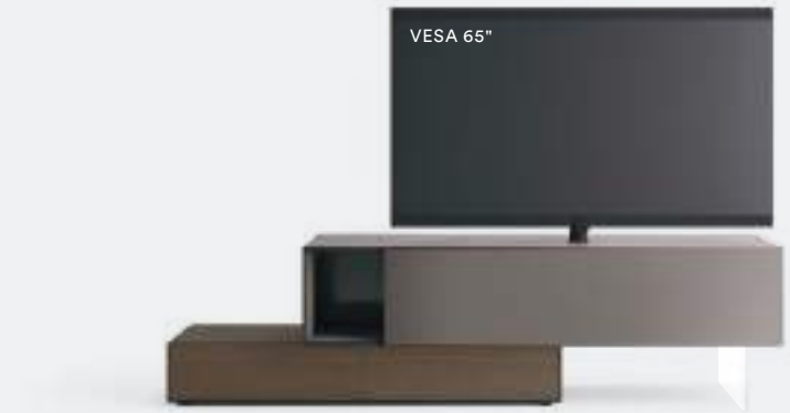
Domino Vesa 12V L / W 2325 x H 630 x P / D 452 / 546 Rovere Argilla • Piombo