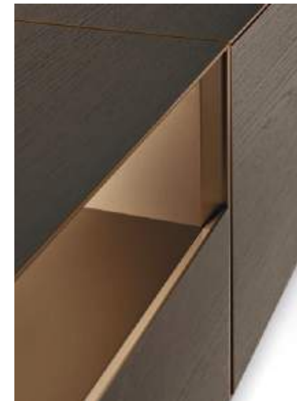
Base Domino Più 6P L / W 2700 x H 525 x P / D 546 TV max 75"

Domino Più, ovvero più elementi che si accostano l'uno con l'altro, in un susseguirsi cromatico che si sviluppa in senso orizzontale. La lavorazione a 45° dei frontali offre una comoda presa per l'apertura del cassetto, senza bisogno di maniglie esterne. Raffinatamente senza tempo è l'abbinamento fra la base Domino Più in Rovere Argilla, con interno laccato Bronzo e i pensili laccati completamente Bronzo e Piombo o con l'esterno in Rovere Argilla e interno Bronzo e Piombo. Il sistema di illuminazione a led, integrato nel retro della base, crea un effetto estetico ma aiuta anche a riposare la vista mentre si guarda la TV.