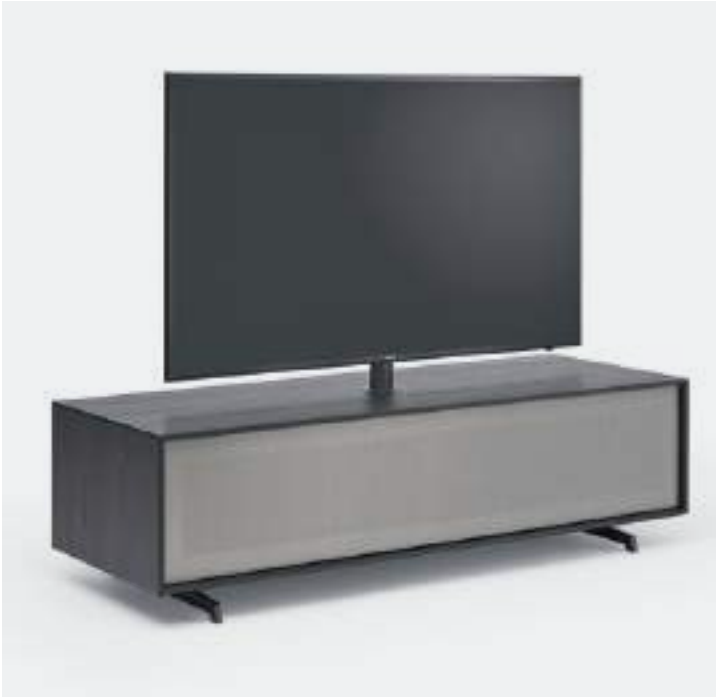
STAFFA VESA / VESA STAND

On some bases with drop-down door, the Vesa swivel TV stand can be fitted as an option. It allows you to rotate the screen, with cables passing inside the cylindrical metal element.