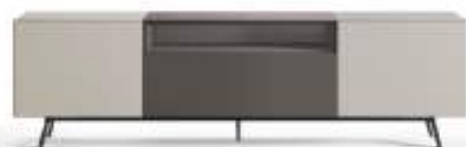
Domino Più 10P L / W 2100 x H 600 x P / D 546 Grigio Corda • Piombo • piedi / feet Brown