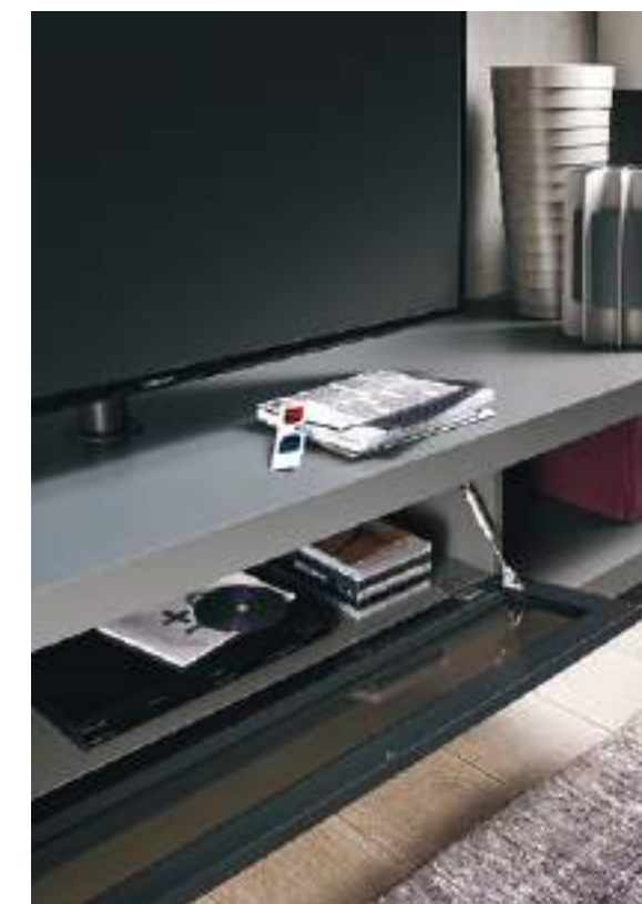
Base Sp60 CDG2708C sx tipo B L / W 2700 x H 480 x P / D 546 Vesa per TV 65"

Una delle molteplici combinazioni possibili per la base composta da piani di spessore 60 mm, abbinati a elementi a ribalta, cassettiere o elementi a giorno, in un libero gioco di linee e volumi. La composizione qui proposta è in finitura Ferro e Vinaccia e Grigio Corda opaco. Nell'elemento con supporto TV orientabile Vesa, il frontale a ribalta in Stopsol permette agli impianti interni di ricevere il segnale del telecomando.