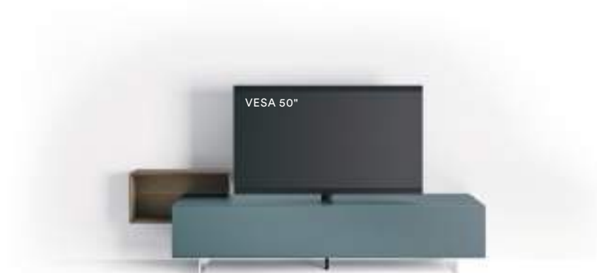
Domino Vesa 6V sx L / W 2100 x H 420 / 570 x P / D 546 / 245 Avio • Rovere Argilla

These Domino Più bases comprise a linear base and open element D 250 mm, which adds a dynamic effect while also acting as a convenient bookshelf. The composition can also be backlit to create a pleasant atmosphere. On the left we see a composition in Rovere Carbone with container interior in Brown and methacrylate feet H 120 mm.