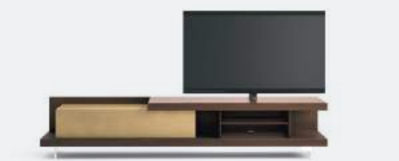
Base Sp60 CDC2408C dx tipo A L / W 2400 x H 480 x P / D 546. Vesa per TV max 55" Rovere Termotrattato • Ottone