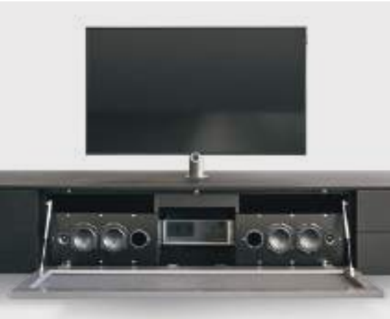
FRONTALE MICROFORATO / MICRO-PERFORATED FRONT PANEL

The Vesa swivel TV stand can be used on Lampo bases with standard tops or with frame.