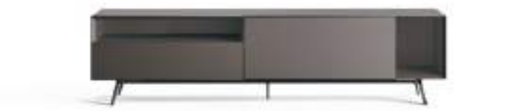
Domino Più 3P sx L / W 2100 x H 525 x P / D 546 Piombo