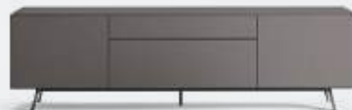
Domino Mono 9M L / W 2092 x H 600 x P / D 546 Piombo