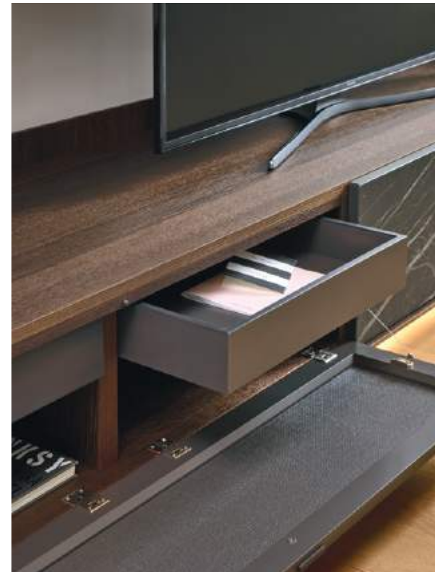
Base Cabaret Ceramica 3E L / W 2420 x H 515 x P / D 570

I frontali in Ceramica con effetto Noir Desir, in abbinamento alla finitura Rovere Termotrattato, rendono particolarmente suggestivo questo elemento d'arredo, conferendogli un particolare carattere estetico. Come si vede nell'immagine, alcune basi con ribalta possono essere dotate, su richiesta, di cassetti interni.