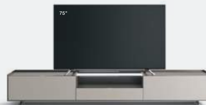
Cabaret 4C L / W 2720 x H 435 x P / D 570 – Teca H 160 Grigio Corda • Piombo • piedi / feet Piombo