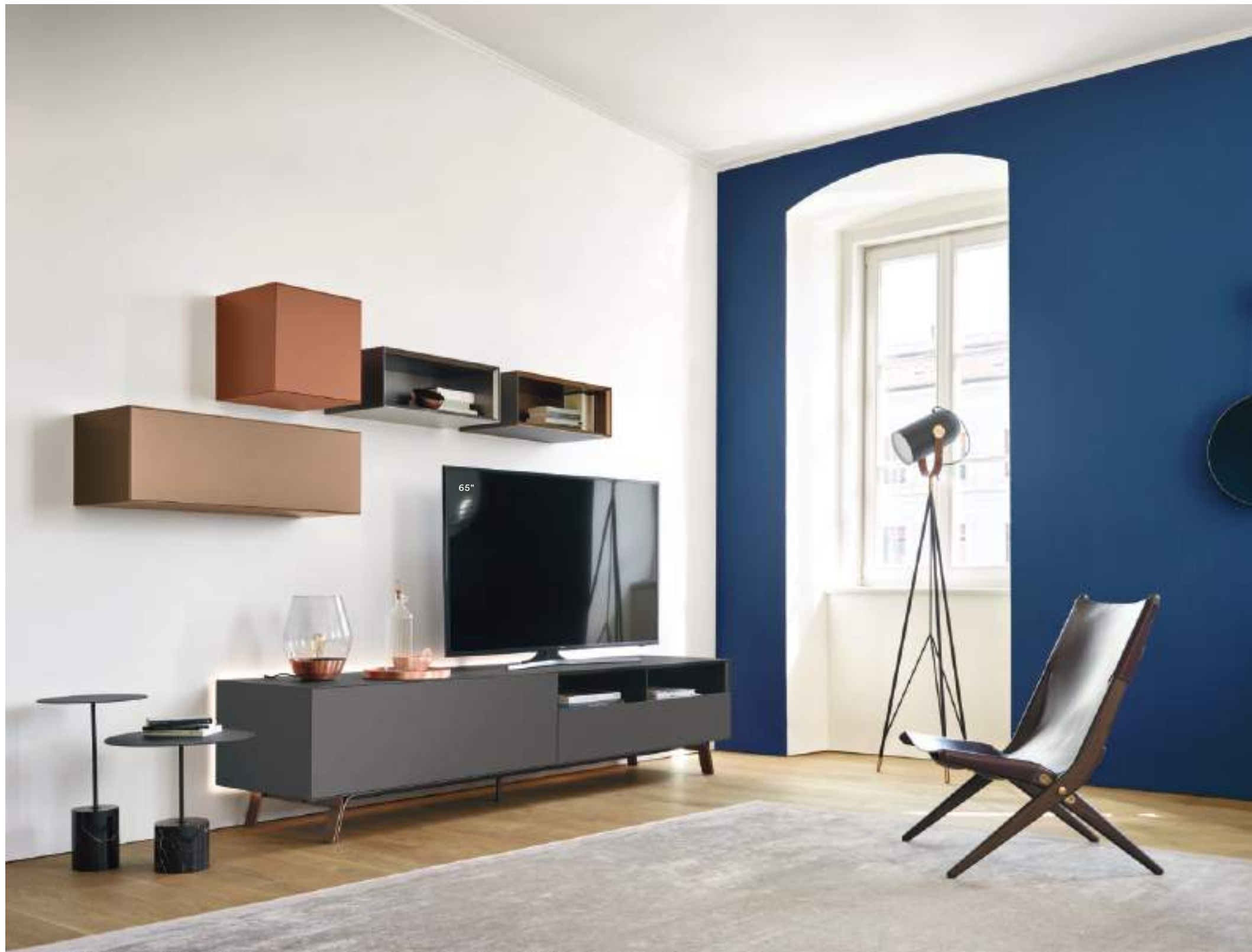
Base Domino Più 4P sx L / W 2400 x H 525 x P / D 546