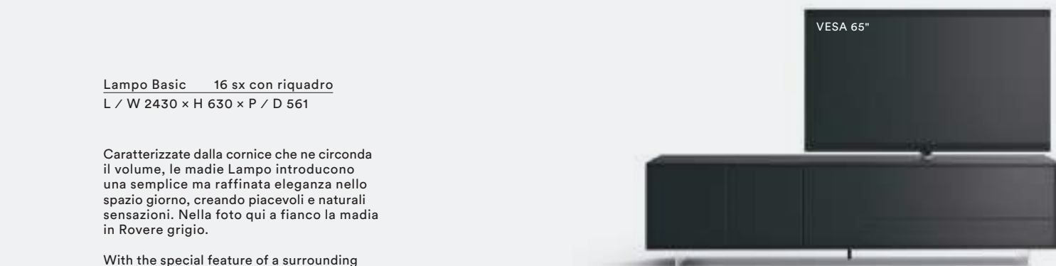
Lampo Basic 16 sx con riquadro L / W 2430 x H 630 x P / D 561

Caratterizzate dalla cornice che ne circonda il volume, le madie Lampo introducono una semplice ma raffinata eleganza nello spazio giorno, creando piacevoli e naturali sensazioni. Nella foto qui a fianco la madia in Rovere grigio.