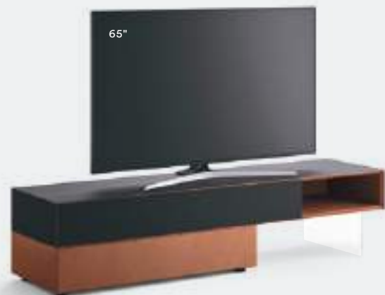
Domino IN.2 14I L / W 2100 x H 480 x P / D 546 Rovere Carbone • Rame