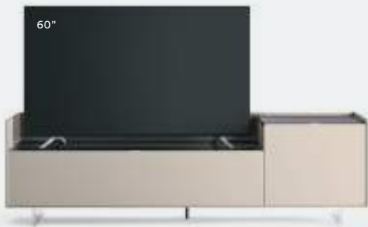
Cabaret 64D dx L / W 2120 x H 635 x P / D 570 – Step H 160 Grigio Corda • Top Nero Greco • piedi metacrilato / methacrylate feet H 120

Una panoramica di basi Cabaret in diverse finiture, configurazioni e dimensioni dove il gioco dei volumi in altezza è realizzato con un piano ribassato di 160 mm che determina spazi espositivi diversi: per appoggiare semplicemente la TV o per creare un vassoio su cui riporre vari oggetti.