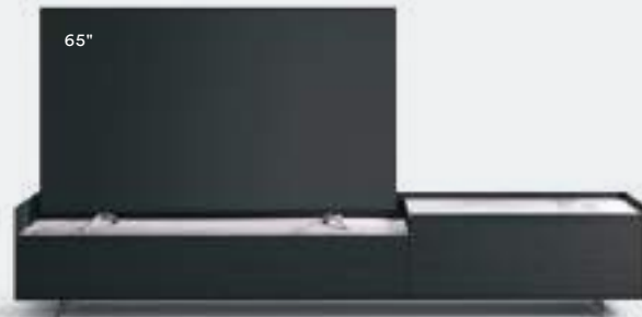
Cabaret 52G dx L / W 2420 x H 435 x P / D 570 – Step H 80 Rovere Carbone • Top Statuarietto • piedi / feet Piombo