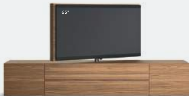
Roto 07 L / W 2700 x H 1575 x P / D 570 Noce