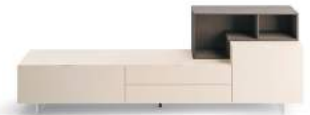
Lampo Open 10 L / W 2400 x H 800 x P / D 354 / 450. TV max 65" Canapa • Loto Terra • piedi in metacrilato / methacrylate feet H 120