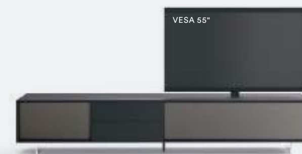
Incontro con riquadro 601 L / W 2430 x H 470 x P / D 561 Rovere Carbone • Piombo • piedi metacrilato / methacrylate feet H 120