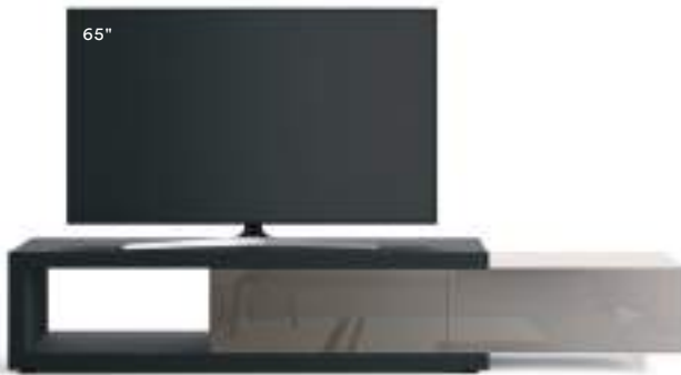
Lampo Sp60 5 L / W 2550 x H 460 x P / D 450. TV max 75" Rovere Carbone • Ardesia Lucido