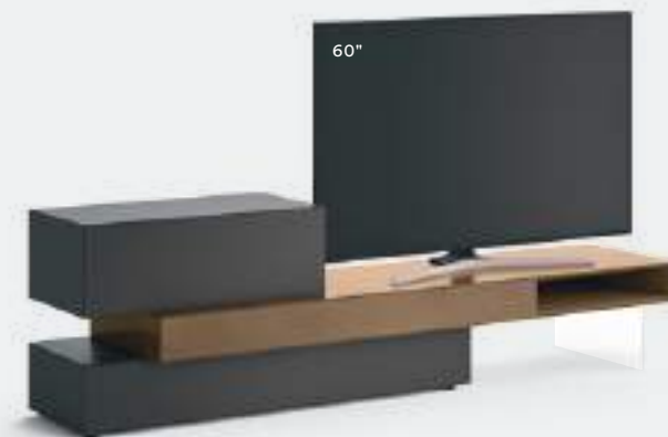
Domino IN.3 17N L / W 2325 x H 705 x P / D 452 / 546 Brown • Bronzo

Three elements give shape to a piece of furniture with a unique personality. Various combinations are built up to create a dynamic but compact result, or play on extreme differences between the volumes, the acrylic feet helps to create a free standing composition.