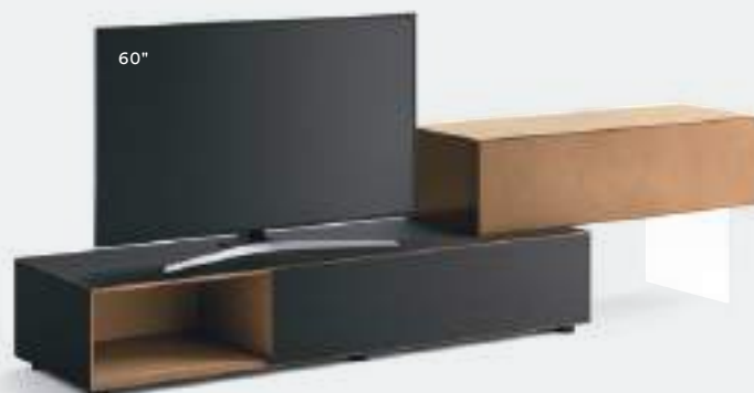
Domino IN.2 15I L / W 2625 x H 630 x P / D 452 / 546. TV max 60" Rovere Carbone • Bronzo

In questi esempi di composizioni, vediamo diverse soluzioni per Domino IN, con molteplici abbinamenti di colori e finiture, in un'alternanza di laccati opachi, finiture metalliche, esterni impiallacciati e interni laccati.