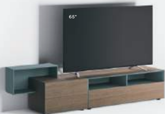
Domino Più 9L sx L / W 2100 x H 555 x P / D 245 / 546 Rovere Argilla • Avio