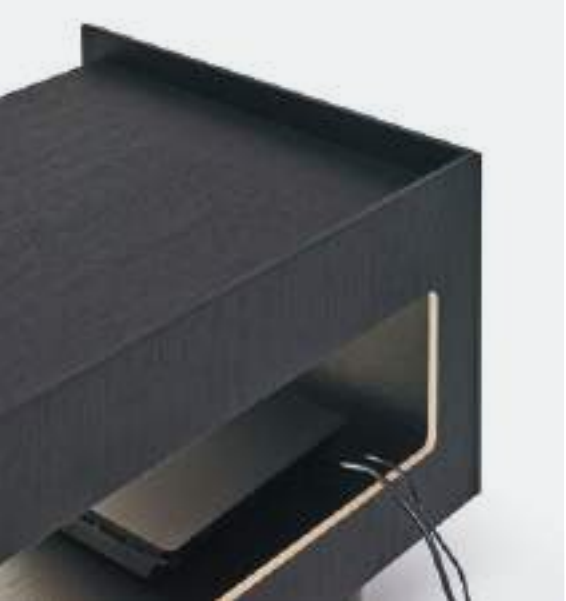
ASOLA SULLO SCHIENALE / SLOT ON THE BACK

È possibile realizzare un'asola sullo schienale per agevolare il cablaggio degli impianti collocati dentro le basi con ribalta.