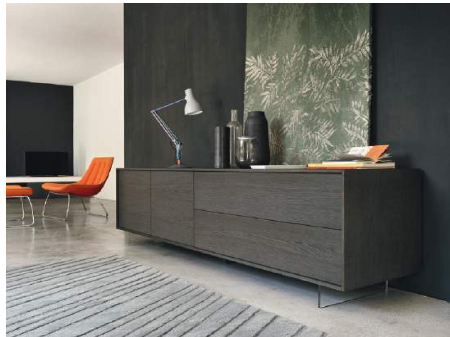
Lampo Basic 16 sx con riquadro L / W 2430 x H 630 x P / D 465 Rovere Grigio • piedi metacrilato / methacrylate feet H 120