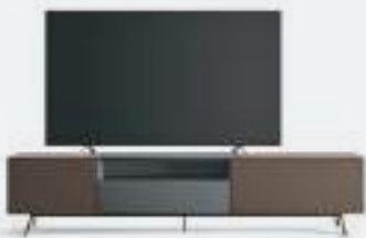
Domino Più p 10