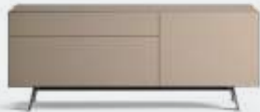
Domino Mono 3M dx L / W 1492 x H 600 x P / D 546. TV max 65" Ombra • piedi / feet Piombo

Domino Mono ha una struttura unica che permette diverse combinazioni di elementi e finiture, trasformandosi a seconda dei gusti personali e del contesto stilistico. È possibile abbinare l'esterno impiallacciato con i cassetti laccati in una tonalità diversa. Nell'immagine, una madia in Rovere Argilla con interno e cassetti e piedi laccati Piombo.