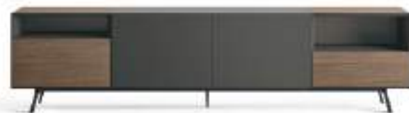
Domino Più 13P L / W 2400 x H 600 x P / D 546 Rovere Argilla • Antracite • piedi / feet Brown