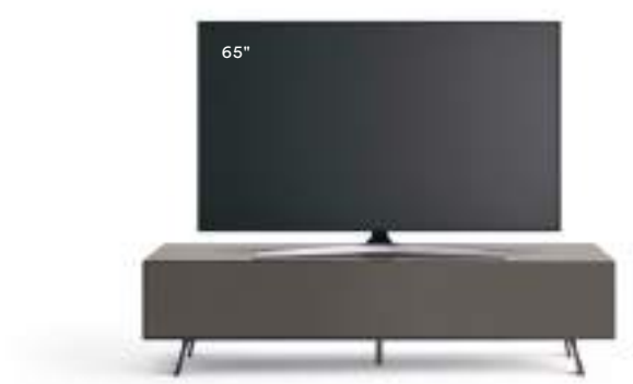
Domino Mono L / W 1800 x H 450 x P / D 546 Piombo

Con Domino Mono bastano pochi ed essenziali elementi, con struttura unica, bordi con lavorazione a 45° e diverse combinazioni di frontali, per creare un'interessante situazione d'arredo. In questa composizione la base è in Rovere Carbone, tonalità profonda ed elegante, con interno laccato opaco Amarena che aggiunge un tocco di vivacità. I pensili sono in Rovere Carbone con interno Piombo, laccato Piombo e laccato opaco Oltremare.