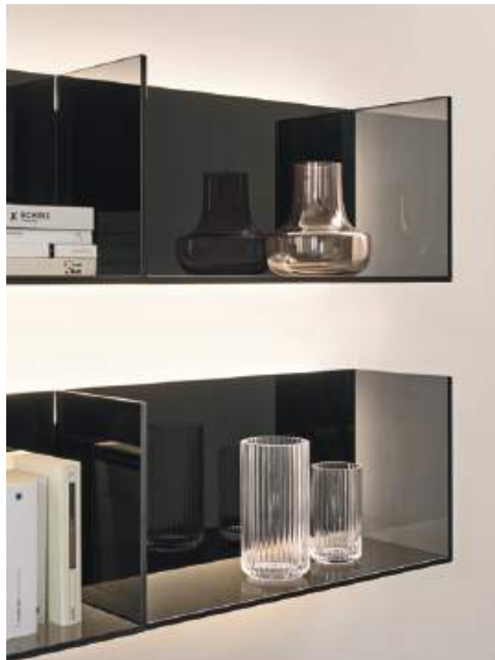
Domino Più 14P sx L / W 2400 x H 570 x P / D 546

Emozionale ed essenziale allo stesso tempo, questa composizione abbina una base Domino Più in Caffè opaco, con mensole in vetro fumé retroilluminato, creando un ambiente raffinato.