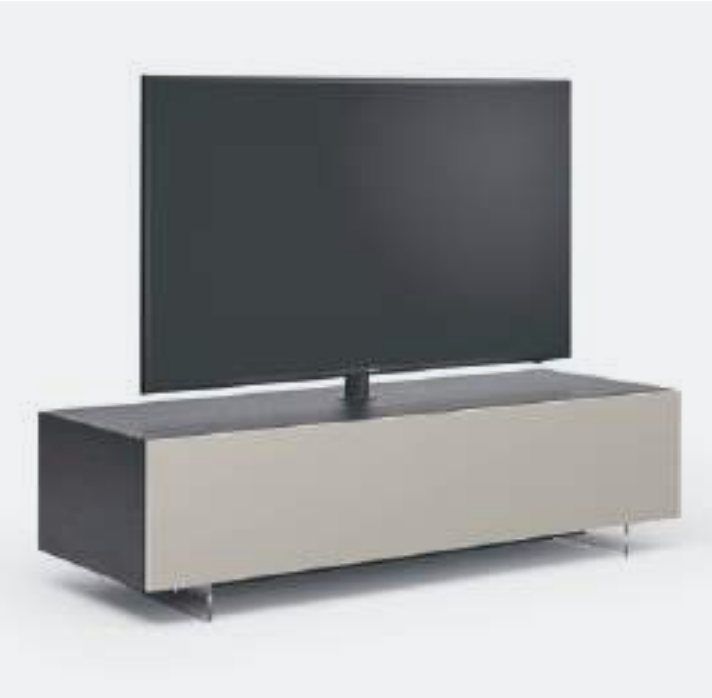
STAFFA VESA / VESA STAND

Su alcune basi con ribalta, può essere inserito come optional il supporto TV orientabile Vesa che permette di ruotare lo schermo, con passaggio dei cavi all'interno dell'elemento cilindrico in metallo.