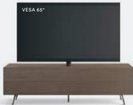
Domino Mono L / W 1800 x H 525 x P / D 546 Rovere Argilla-Creta • piedi / feet Piombo