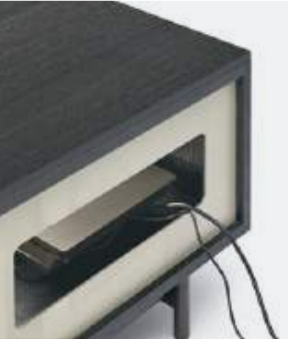
ASOLA SULLO SCHIENALE / SLOT ON THE BACK

Su richiesta, è possibile realizzare una apposita asola sullo schienale per facilitare il cablaggio degli impianti posti all'interno delle basi con ribalta.