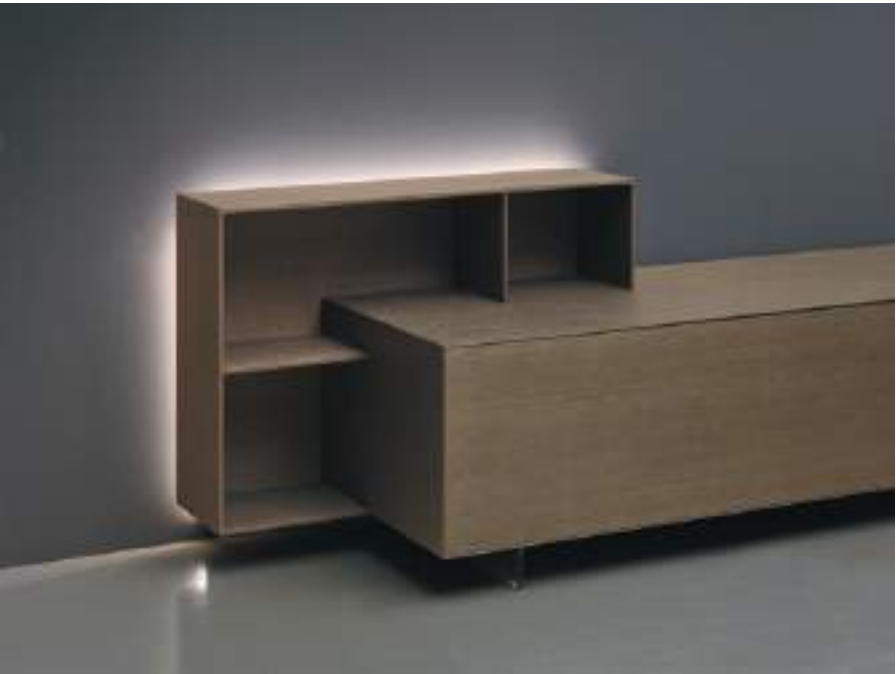
RETROILLUMINAZIONE / BACK-LIGHTING