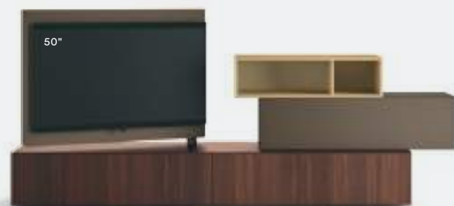
Vision 02 L / W 2700 x H 1200 x P / D 354 / 546 Rovere Termotrattato • Terranova • Ottone

Esempi di varie configurazioni, dalla semplice sovrapposizione di elementi diversi, all'inserimento nella composizione di un elemento Scrigno con funzioni di contenimento e di esposizione, come in un'elegante vetrina. Le strutture sono autoportanti e quindi non necessitano di fissaggi a parete.