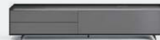
Cabaret 2A sx L / W 2120 x H 435 x P / D 570 Rovere Carbone • Piombo • piedi / feet Piombo