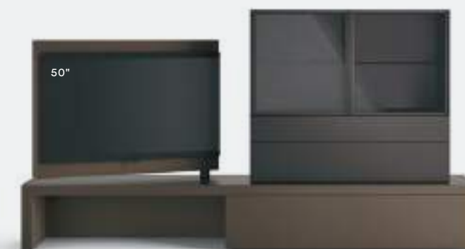
Vision 04 L / W 2700 x H 1435 x P / D 354 / 546 Terranova • Brown

Examples of various configurations, from simply stacking different elements, to the insertion of an elegant Scrigno cabinet, used for storage and display. The structures are self-supporting and do not require anchoring to the wall.