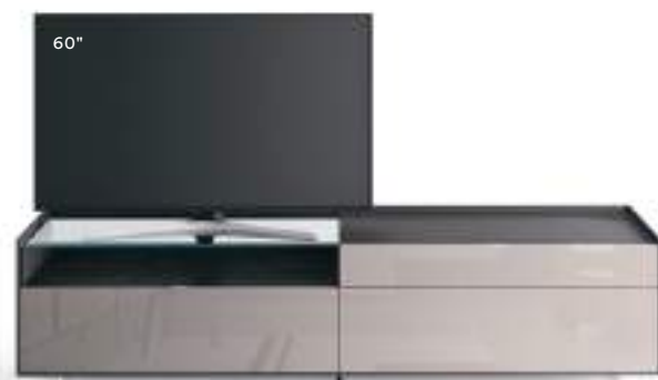
Cabaret 15B dx L / W 2420 x H 635 x P / D 570 – Teca H 160 Rovere Carbone • Grigio Corda Lucido • piedi metacrilato / methacrylate feet H 120

The TV can sit freely on the base, or in some combinations, the Vesa swivel TV stand can be attached. For each composition, the recommended and maximum screen sizes are specified.