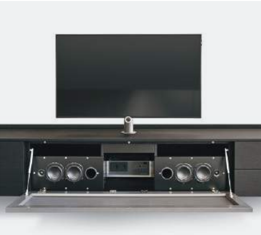
FRONTALE MICROFORATO / MICRO-PERFORATED FRONT

On some bases with drop-down door, the Vesa swivel TV stand can be fitted as an option. It allows you to rotate the screen, with cables passing inside the cylindrical metal element.