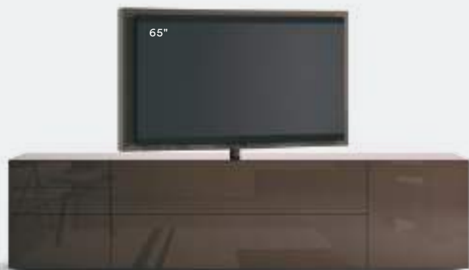
Roto 08 L / W 2700 x H 1735 x P / D 570 Terranova lucido