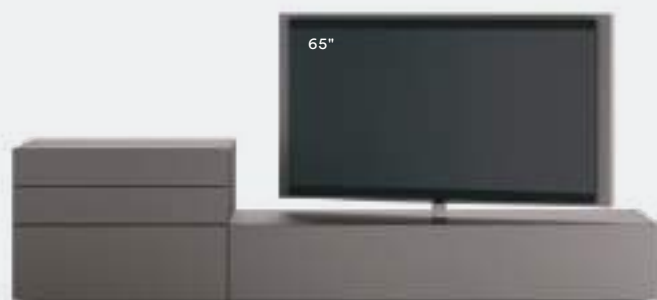
Roto 09A L / W 2700 x H 1415 x P / D 570 Piombo