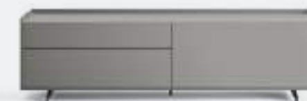
Cabaret 7A sx L / W 1820 x H 515 x P / D 570 TV max 75" Ardesia • piedi / feet Piombo