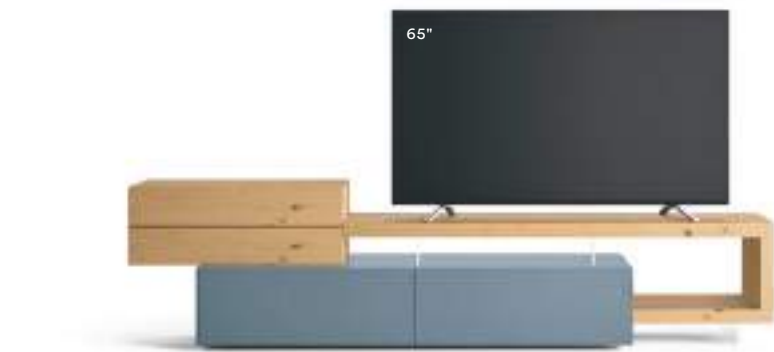
Lampo Sp60 33 L / W 2700 x H 655 x P / D 450 / 546. TV max 70" Nodato Naturale • Pervinca