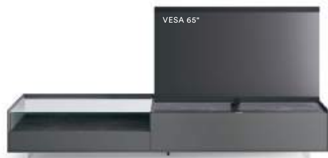
Cabaret 4B dx L / W 2720 x H 475 x P / D 570 – Teca H 160 Ferro • Top Nero Greco • piedi metacrilato / methacrylate feet H 120