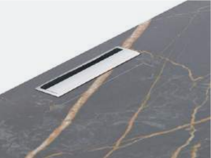
PASSACAVI / CABLE SLOTS

The Vesa swivel TV stand can also be installed on bases with ceramic tops.