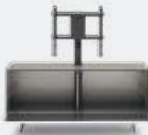
Domino details p 36