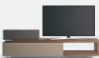
Vision p 114