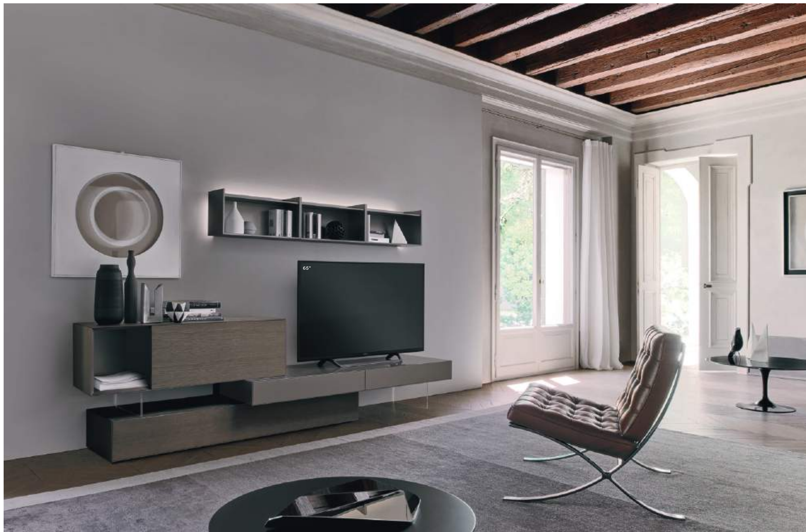
Base Domino IN.3 19N L / W 2775 x H 780 x P / D 452 / 546

Tecnologia, design e architettura convivono in perfetta armonia, disegnando un ambiente elegante e raffinato, nel quale la sovrapposizione di tre elementi è sufficiente a comporre un'atmosfera ideale. In foto, l'abbinamento del Rovere grigio con il laccato metallo Piombo.