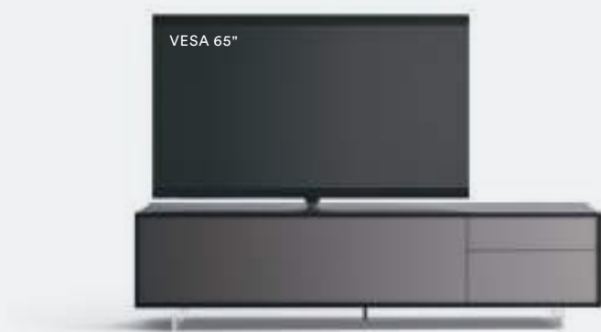
Lampo Basic 9 sx con riquadro L / W 2130 x H 550 x P / D 561 Rovere Carbone • Piombo • piedi metacrilato / methacrylate feet H 120