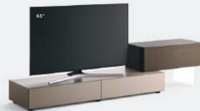
Domino IN.2 16I L / W 2475 x H 555 x P / D 452 / 546 Rovere Argilla-Terranova • Ombra