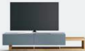
Roto p 120