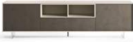
Lampo Open 39 L / W 2130 x H 630 x P / D 465