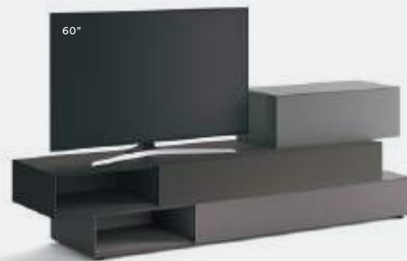
Domino IN.3 23N L / W 2325 x H 780 x P / D 452 / 546 Ferro • Piombo • Antracite

Tre elementi danno forma a un complemento d'arredo dalla personalità unica. Diverse sovrapposizioni posso creare una soluzione dinamica ma compatta, oppure estremizzare il gioco fra i diversi volumi, a sostegno il piede in metacrilato, che rende tutto autoportante.