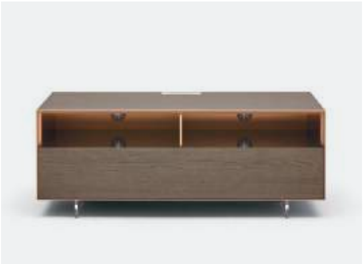
PASSACAVI / CABLE SLOTS

On some bases with drop-down door, the Vesa swivel TV stand can be fitted as an option. It allows you to rotate the screen, with cables passing inside the cylindrical metal element.