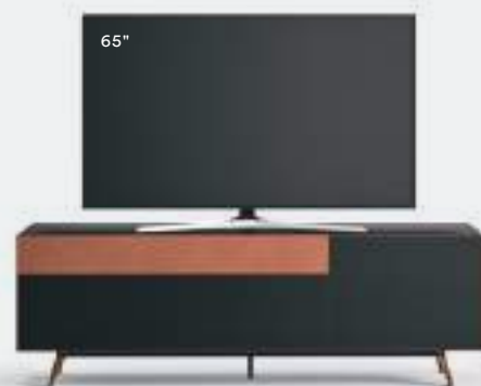
Domino Mono 5M dx L / W 1792 x H 600 x P / D 546. TV max 75" Rovere Carbone-Rame • piedi / feet Rame