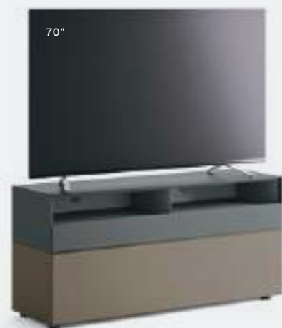
Domino IN.2 4l L / W 1500 x H 705 x P / D 452 Visone • Ferro