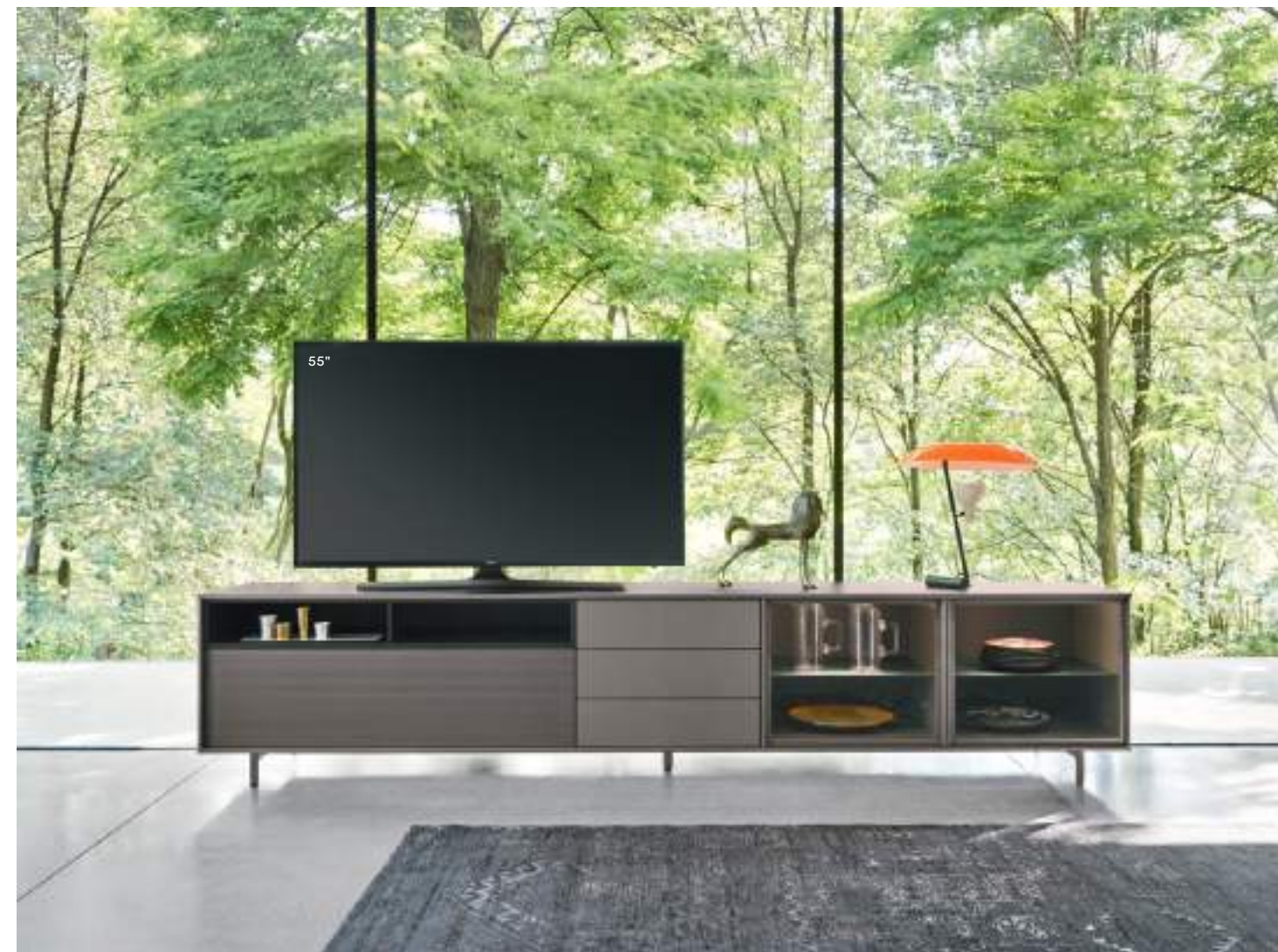
Scigno con riquadro 300 L / W 3015 x H 630 x P / D 561

Una soluzione d'arredo che unisce le funzioni di contenimento, esposizione e intrattenimento multimediale. L'elemento dotato di frontale microforato può essere attrezzato con altoparlanti. L'elemento è proposto interamente in finitura laccata metallo Piombo. Con piedi cilindrici H 120.