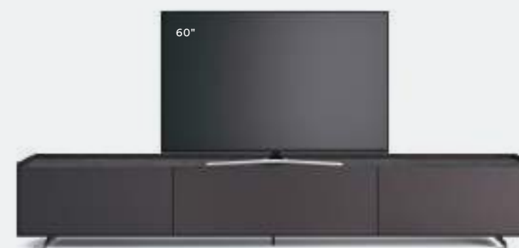
Cabaret 12A L / W 3020 x H 515 x P / D 570 Brown • Top Pietra Savoia • piedi / feet Brown

Fra le varie personalizzazioni, c'è la possibilità di attrezzare l'anta a ribalta anteriore con un frontale microforato che permette di gestire l'impianto all'interno con il telecomando, nascondendolo alla vista.