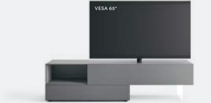
Domino Vesa 11V L / W 2100 H 555 P 546 Ardesia