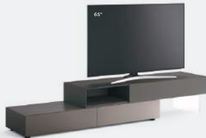
Domino IN.2 18I L / W 2550 x H 480 x P / D 546. TV max 70" Piombo • Antracite