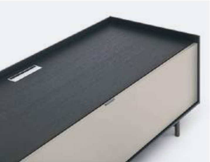
PASSACAVI / CABLE SLOTS

For cables, an elegant aluminium cable slot can be inserted into both wood and ceramic tops.