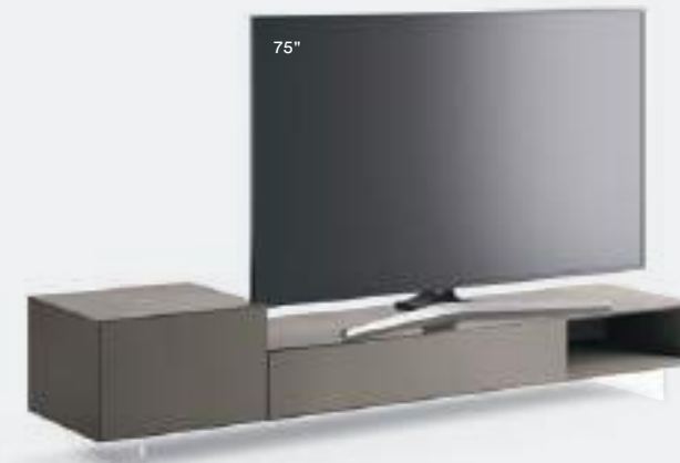
Domino Più 7P L / W 2400 H 495 P 546 Piombo