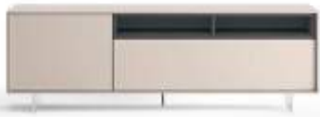
Lampo Open 38 L / W 1830 x H 630 x P / D 465. TV max 75"

An external perimeter that contains multiple combinations. Opposite, the Units TV Open element is shown with a combination of structure in matt Grigio Corda and drawers in Loto Terra, with open compartment in Rovere Carbone. All supported by metal feet H 180 mm high, in matt Brown. In the compositions below, various combinations of lacquered Grigio Corda and Loto Terra, with methacrylate feet H 120 mm.