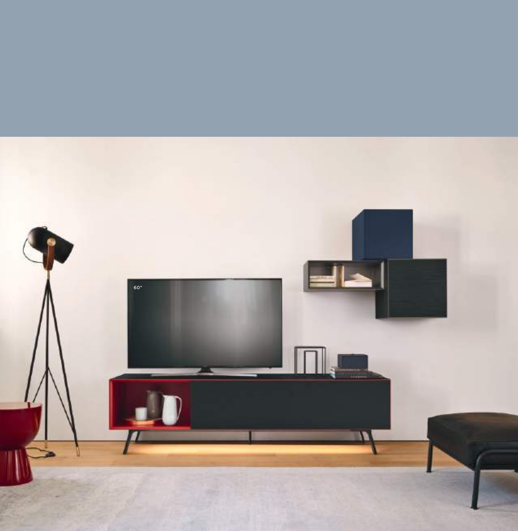
Base Domino L / W 2100 x H 525 x P / D 546