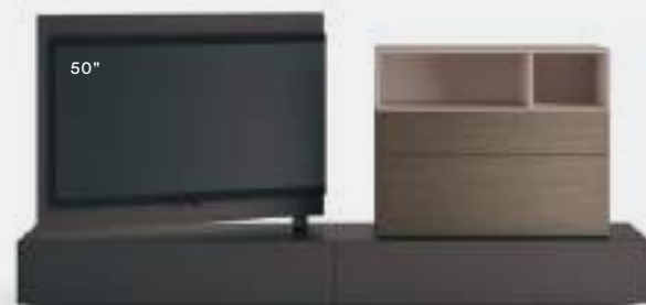
Vision 03 L / W 2400 x H 1200 x P / D 354 / 546 Brown • Rovere Argilla • Ombra