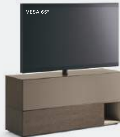
Domino Vesa 10V sx L / W 1500 x H 705 x P / D 452 Rovere Argilla • Visone