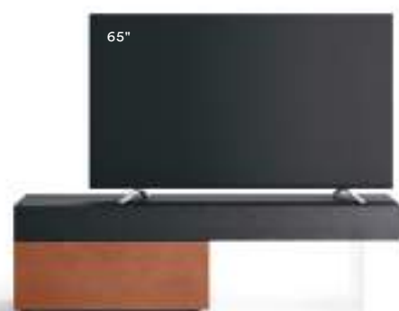
Lampo Basic 25 sx L / W 1800 x H 495 x P / D 546. TV max 75" Rovere Carbone • Rame