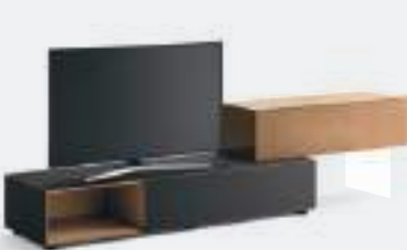
Domino IN.2 p 24