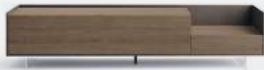
Cabaret 51D sx L / W 2120 x H 475 x P / D 570. TV max 65" – Step H 160 Rovere Argilla • Piombo • piedi metacrilato / methacrylate feet H 120