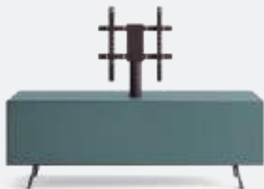
Domino Mono L / W 1500 x H 525 x P / D 546 Avio • piedi / feet Piombo