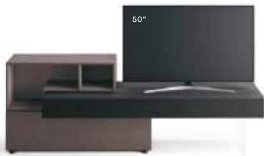
Lampo Open 3 L / W 2100 x H 735 x P / D 354 / 546