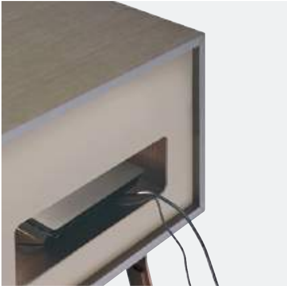
ASOLA SULLO SCHIENALE / SLOT ON THE BACK

Domino bases can be provided with cable organisers that can be positioned on the top and on the back, to allow neat and aesthetically perfect cabling.