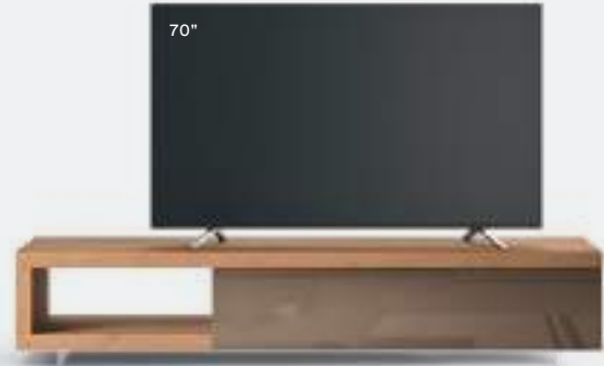
Lampo Sp60 9 L / W 2250 x H 460 x P / D 546 Nodato Caramello • Creta Lucido