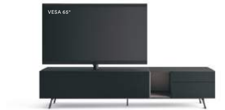
Domino Vesa 1V sx L / W 2400 x H 525 x P / D 546 Rovere Carbone-Piombo • piedi / feet Piombo