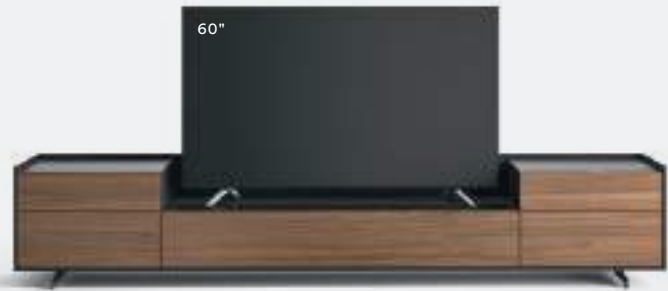
Cabaret 26D L / W 2720 x H 515 x P / D 570 – Step H 160 Noce • Brown • piedi / feet Brown