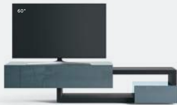
Lampo Sp60 39 L / W 2400 x H 560 x P / D 450 / 546. TV max 65" Rovere Carbone • Pervinca lucido