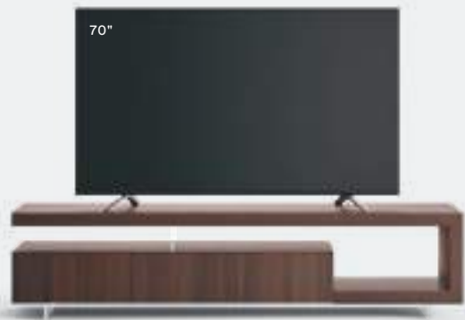
Lampo Sp60 14 L / W 2100 x H 500 x P / D 456 Rovere Termotrattato

60-mm-thick panels form self-supporting structures that do not require wall anchoring; featuring various combinations of woods, lacquers and metal finishes, as well as ceramic front panels. Available with methacrylate feet to support and level the various elements and achieve a feeling of lightness.