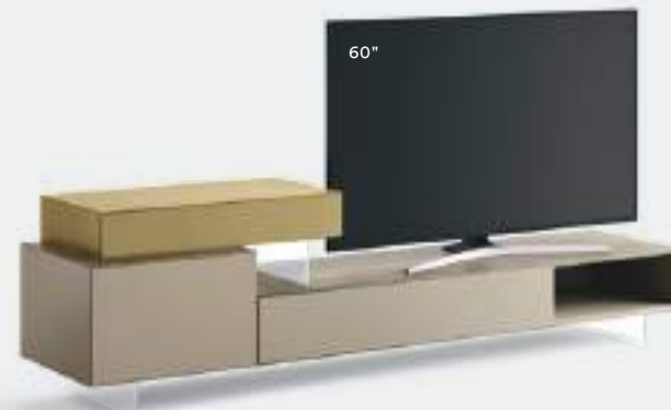
Domino IN.2 17I L / W 2400 H 645 P 452/546 Juta • Ottone