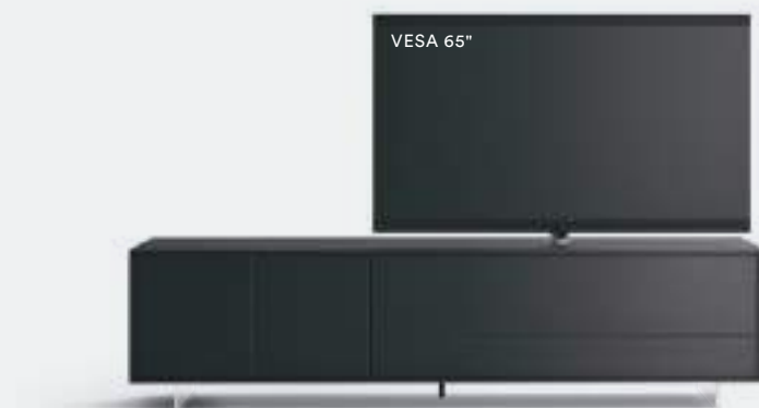
Lampo Basic 18 sx con riquadro L / W 2430 x H 630 x P / D 561 Rovere Carbone • piedi metacrilato / methacrylate feet H 120

With the special feature of a surrounding frame, Lampo sideboards introduce a simple but refined elegance into the living room, creating pleasant and natural sensations. In the photo (right), the sideboard in a Rovere Grigio finish.