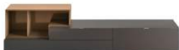
Lampo Open 6 L / W 2400 x H 575 x P / D 354 / 450. TV max 65"

Varie soluzioni che incastrano volumi superiori e inferiori con effetti a volte sorprendenti, sempre mantenendo un perfetto equilibrio fra estetica e funzionalità. Nelle immagini qui sopra, dall'alto in basso: Loto Terra e Rovere Carbone, Loto Natura con elemento centrale Piombo, base Antracite opaco con elemento libreria laccato metallo Bronzo.