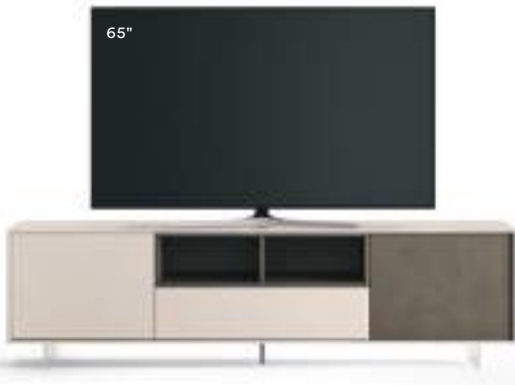
Lampo Open 39 L / W 2130 x H 630 x P / D 465