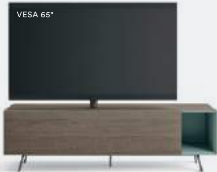
Domino Mono L / W 1800 x H 525 x P / D 546 Rovere Argilla-Timo • piedi / feet Piombo

Il supporto TV orientabile Vesa viene inserito dove previsto sulle basi con ribalta Domino, permettendo il fissaggio e l'orientamento della TV, oltre al passaggio dei cavi al suo interno. Il supporto è già predisposto con foratura standard Vesa che consente di fissare TV con schermi di dimensioni da 32" a 65". Le immagini mostrano diverse possibilità di utilizzo che consentono di avere una base TV attrezzata, anche con un solo elemento.