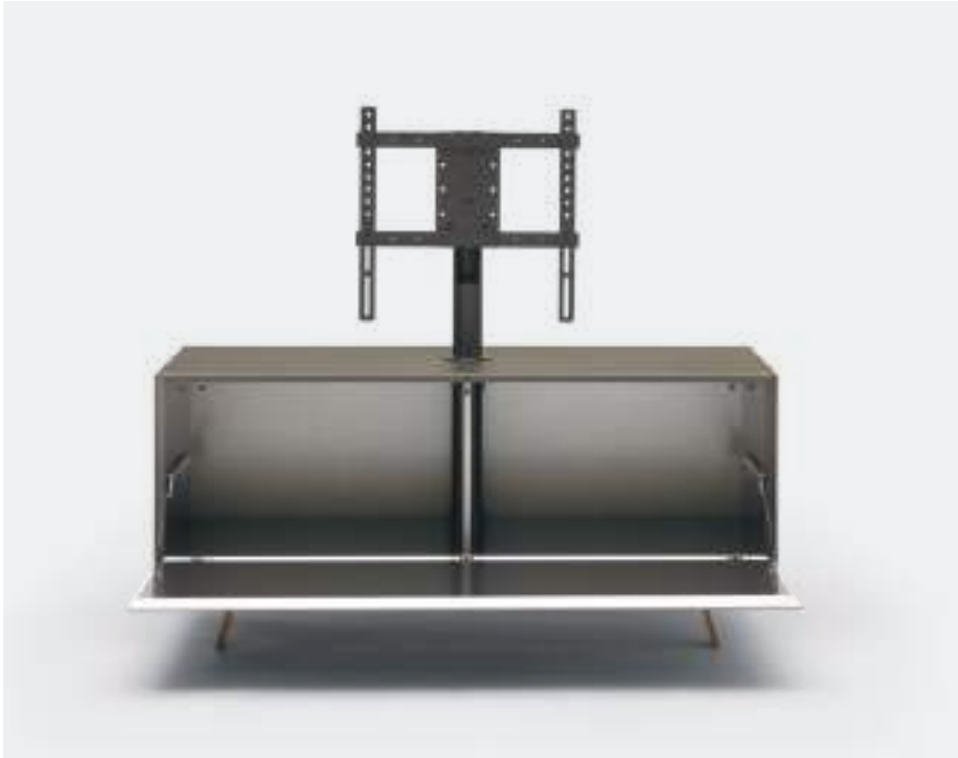
STAFFA VESA / VESA STAND

Su alcune basi con ribalta, può essere inserito come optional il supporto TV orientabile Vesa che permette di ruotare lo schermo, con passaggio dei cavi all'interno dell'elemento cilindrico in metallo.