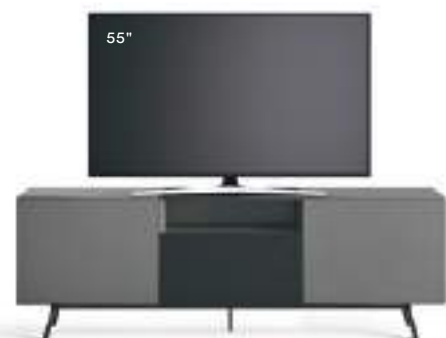
Domino Più 8P L / W 1800 x H 600 x P / D 546. TV max 75" Rovere Carbone • Ferro • piedi / feet Brown