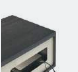
Lampo details p 124