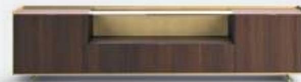
Cabaret 55C L / W 2420 x H 595 x P / D 570 – Teca H 240 Rovere Termotrattato • Ottone • piedi / feet Ottone