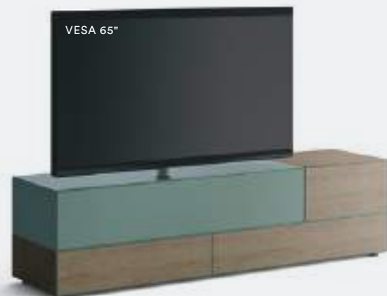
Domino Vesa 4V sx L / W 2100 x H 555 x P / D 546 Rovere Argilla • Timo