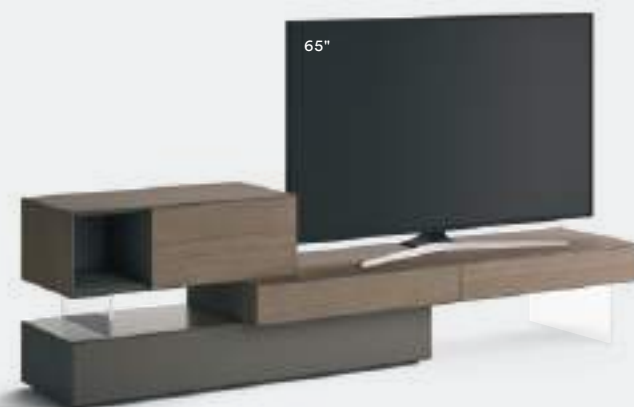
Domino IN.3 18N L / W 2475 x H 705 x P / D 452 / 546 Rovere Argilla • Antracite