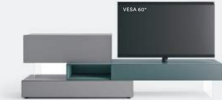
Domino Vesa 15V L / W 2700 H 855 P 452 / 546 Ardesia • Avio

On this page you can see a number of examples of how the Vesa TV stand is used on Domino IN elements with a drop-down door: heights available are 225/300/375 mm. In the picture (left), a matt Brown composition with a central element in matt Visone.