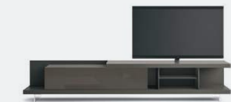
Base Sp60 CDC3008D dx tipo B L/W 3000 x H 560 x P / D 546. Vesa per TV max 65" Antracite • Antracite lucido