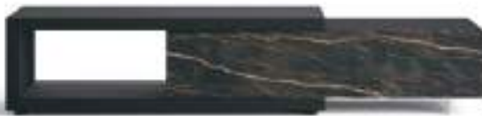
Lampo Sp60 3 L / W 2250 x H 460 x P / D 546 Rovere Carbone • Ceramica Noir Desir